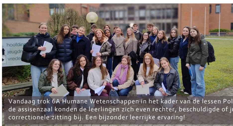
Vandaag trok 6A Humane Wetenschappen in het kader van de lessen Politiek en Recht naar de rechtbank van Brugge. In de assisenzaal konden de leerlingen zich even rechter, beschuldigde of jurylid wanen. Aansluitend woonden ze een correctionele zitting bij. Een bijzonder leerrijke ervaring!