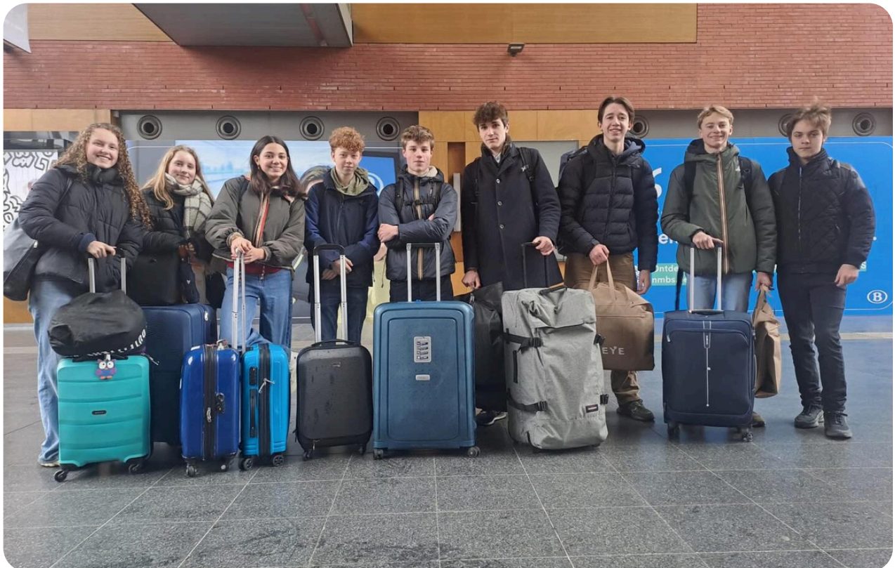
enkele van onze leerlingen onderweg naar het Model European Parliament (MEP)

Aan allen een prettig weekend gewenst. Wij staan maandag graag opnieuw voor jullie klaar!